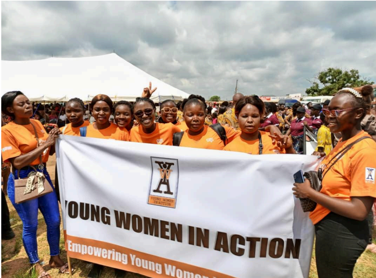
Deelnemers van de Table Banking Group in Zambia in actie tijdens Internationale Vrouwendag.